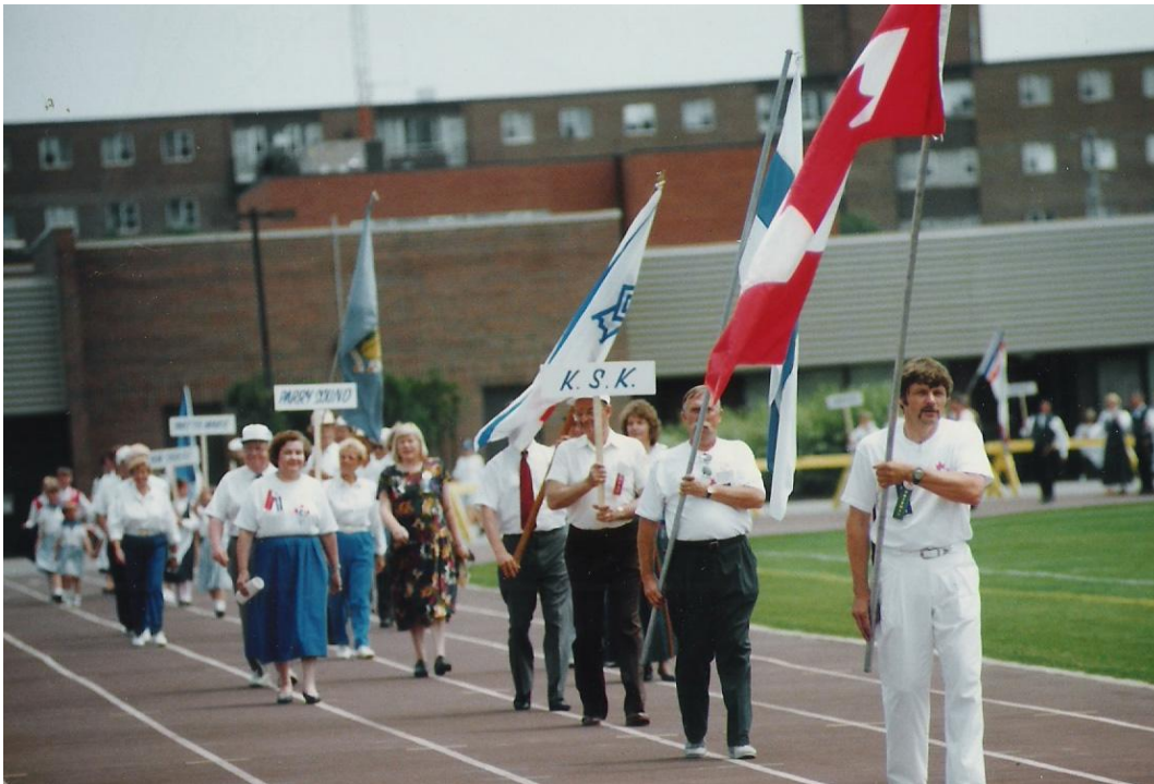
KSK oli melkein alusta pitäen mukana Suurjuhlien avajaismarssissa omien tunnustensa alla.

Canada had adopted the policy of Multiculturalism in 1971 although the official Multiculturalism Act was ratified much later, in 1988. Establishing the Finnish national cultural organization at the same time was just a coincident but a good one.